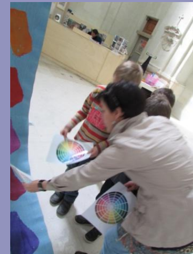
Et chercher sur les œuvres de Viallat...