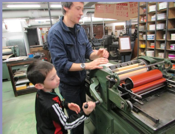
Je tourne une manivelle pour imprimer la « Cigale et la Fourmi ». Nathan J