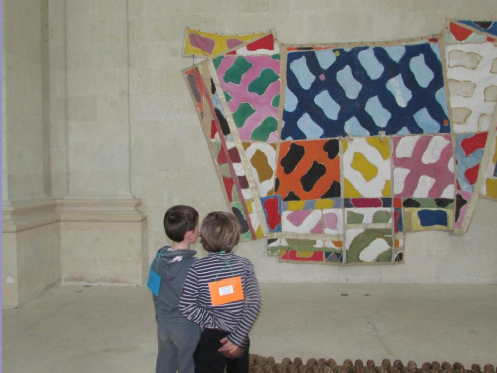
Il peint sur une voile de bateau.