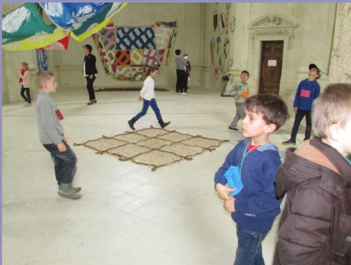
On découvre des œuvres différentes. Jules