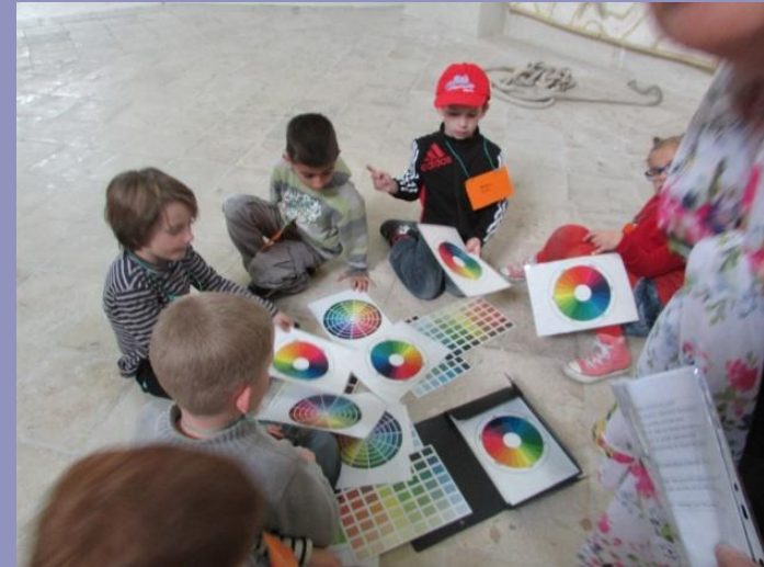
Trouver des noms de couleurs : vert mousse, rouge cerise, jaune citron...